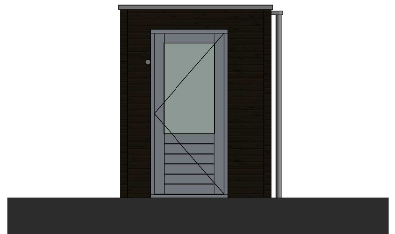
rechtergevel schaal 1:50